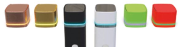
Opzioni multiple di rifinitura cromatiche