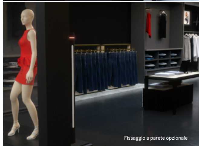
Fissaggio a parete opzionale